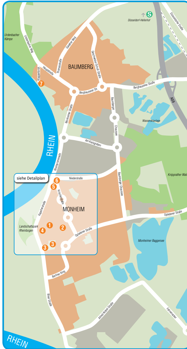
● Stationen MonChronik

7 BAUMBERGER RHEINUFER Das Fangen und Räuchern von Aalen war lange ein wichtiger Wirtschaftszweig in Monheim und Baumberg. Bis in die 1990er Jahre gab es mehrere Räucherreien in der Stadt.